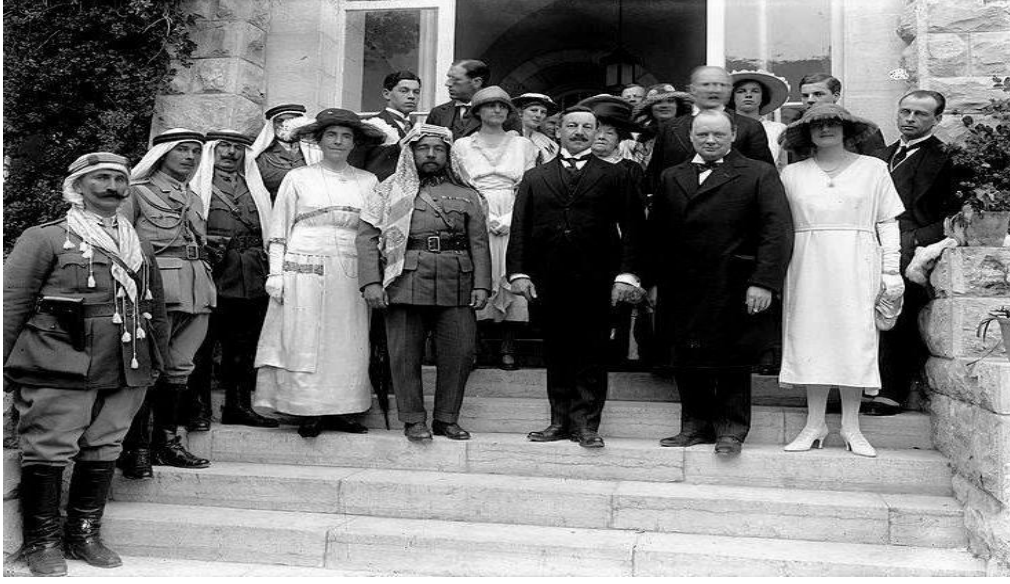
صورة تجمع وينستون تشرشل والمندوب السامي لفلسطين هربرت صموئيل والملك عبد الله على هامش اجتماع القدس 1921.